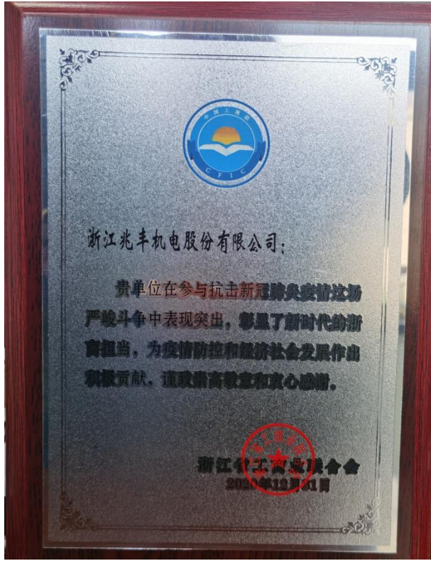
抗击疫情 爱心捐助