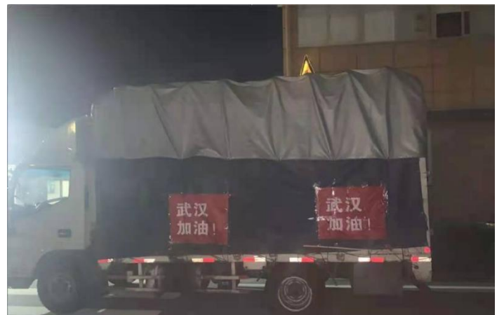
新冠肺炎疫情 捐款捐物